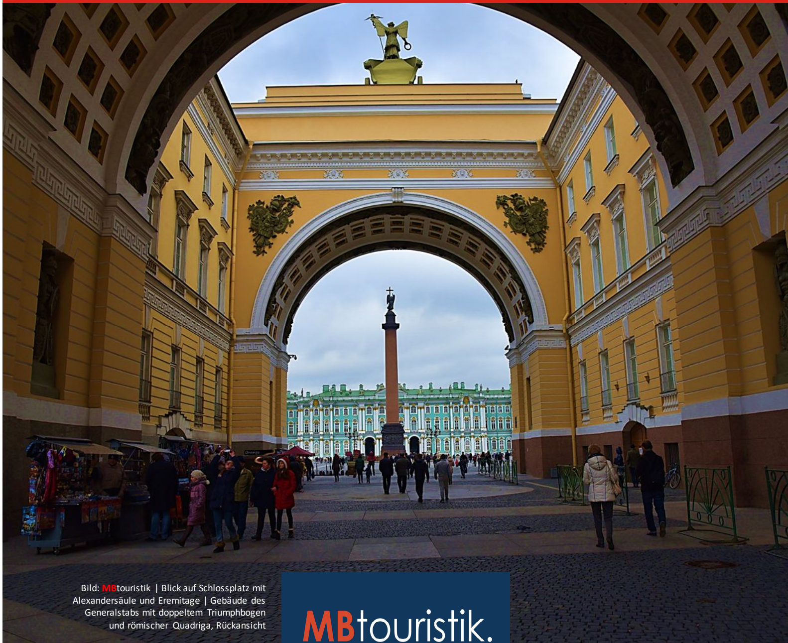
Blick auf Schlossplatz mit Alexandersäule und Eremitage | Gebäude des Generalstabs mit doppeltem Triumphbogen und römischer Quadriga, Rückansicht