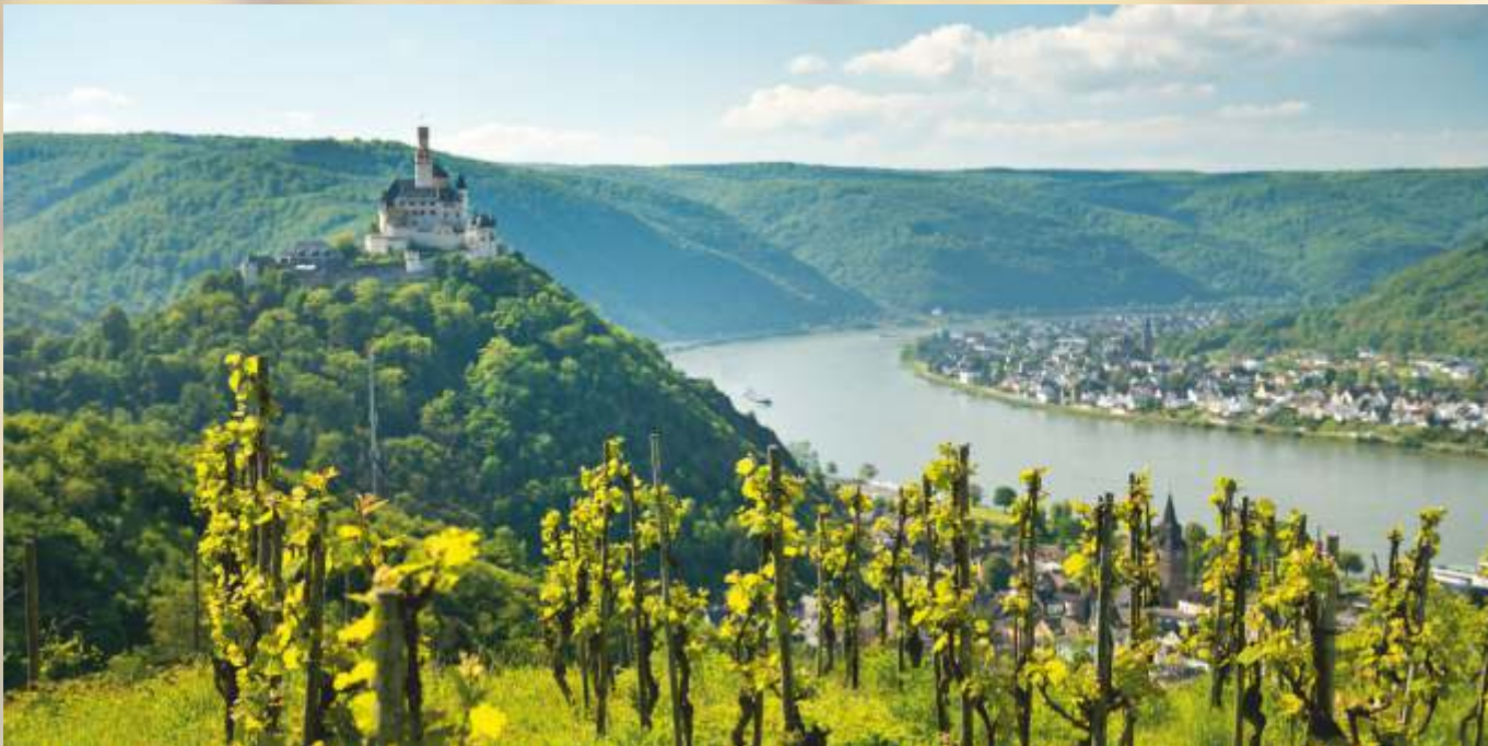
Links: Hoch über dem Rhein: die Marksburg Rechts: Loreley, Postkarte um 1900

*Die Durchführbarkeit dieses Programmpunkts hängt vom derzeit noch unbekanntem Rennkalender des Betreibers ab.