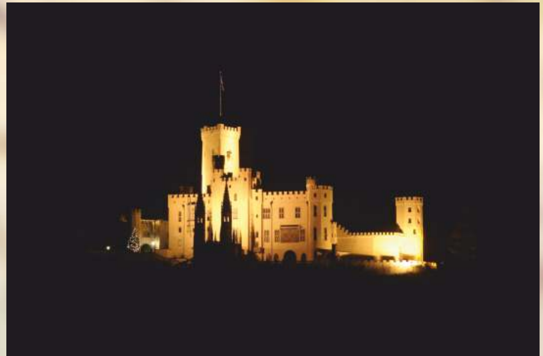
Links: Koblenz, Alte Burg Rechts: Schloss Stolzenfels