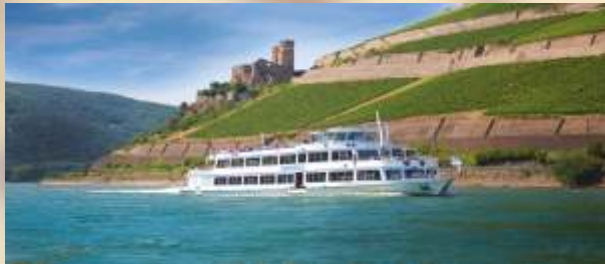
Oben: Rheinschiff vor Burg Ehrenfels Unten: Historische Lahn-Promenade Dausenau Rechts: Idstein im Taunus

Die Ankunft in Stuttgart ist um ca. 22.00 Uhr geplant.