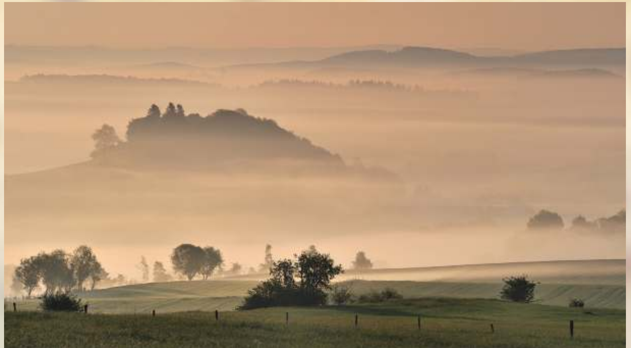
Eifel im Morgennebel

* Eifeler Platt für „Guten Tag an Mosel, Lahn und Rhein!“