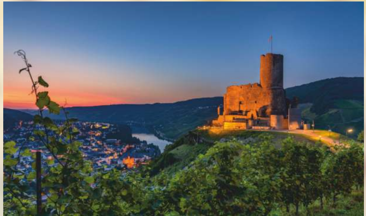
Links oben: Dauner Maare Links unten: Weinhänge an der Mosel Rechts: Blick auf Bernkastel-Kues mit Burgruine Landshut