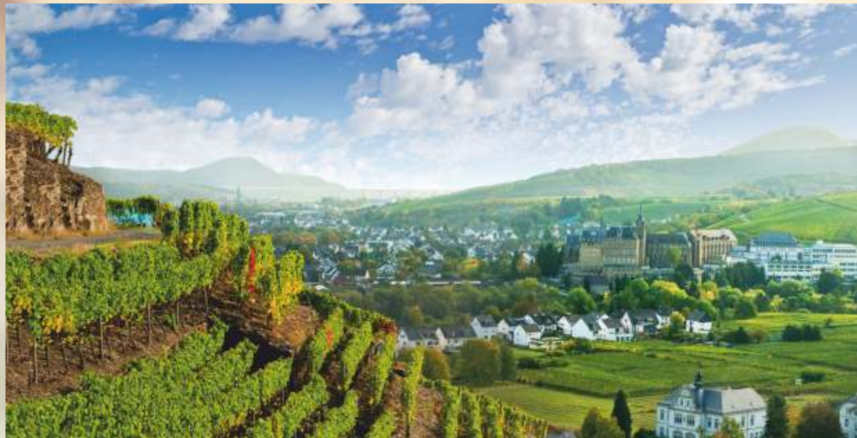
Blick auf Bad Neuenahr-Ahrweiler

Späte Rückkehr zur Übernachtung in unserem Hotel in Boppard.