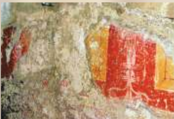
Fresko in der Römervilla Bad Neuenahr-Ahrweiler

Gegen 20.00 Uhr werden wir in unserem Hotel in Boppard zum Abendessen erwartet.