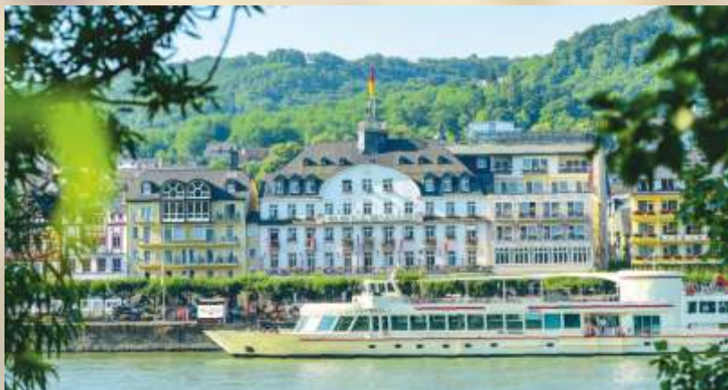
Bild links: Burg Eltz Bild rechts: Unser Hotel ****-S Bellevue Boppard