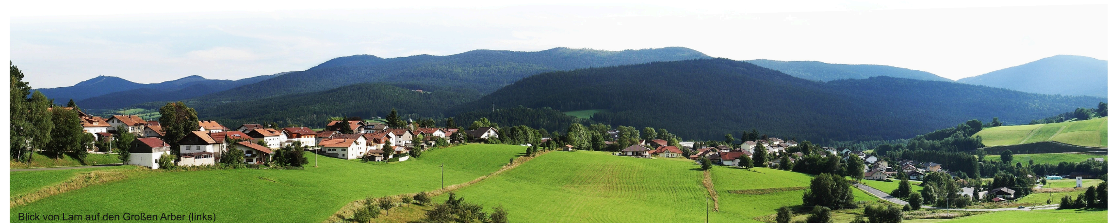
Blick von Lam auf den Großen Arber (links)