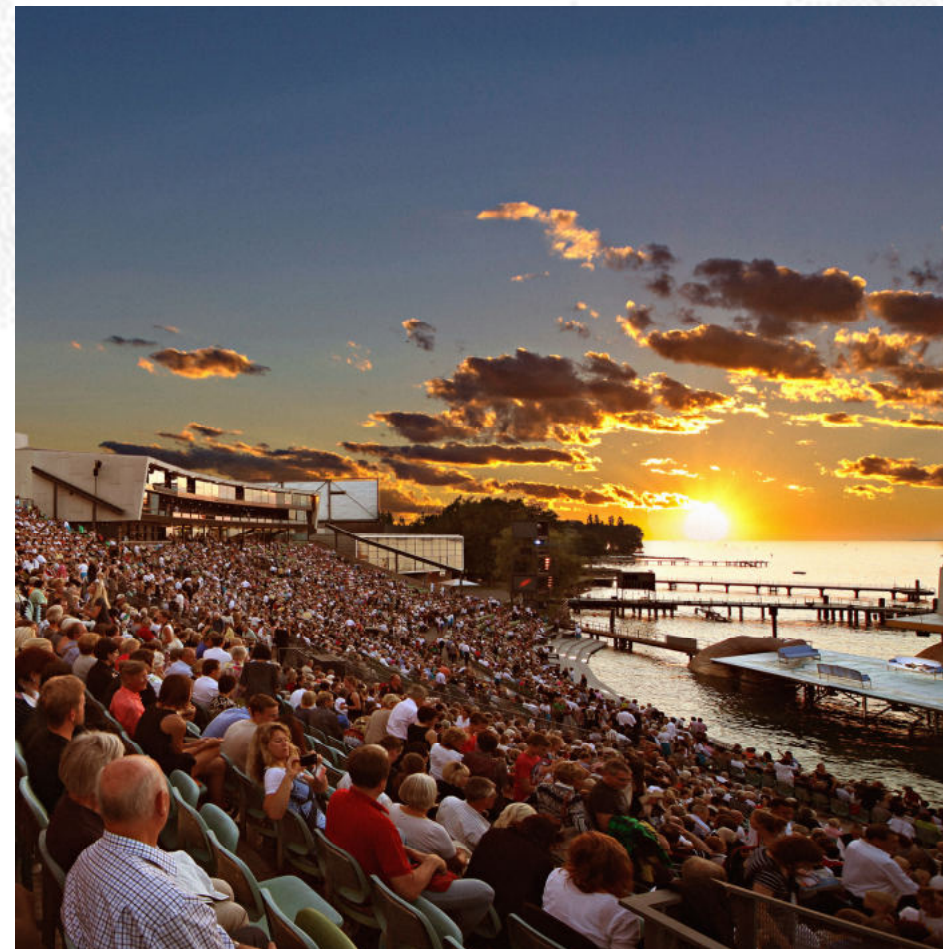
Bild: Publikum auf der Seebühne

Wired Aerial Theatre Statisterie der Bregenzer Festspiele Bregenzer Festspielchor Prager Philharmonischer Chor Wiener Symphoniker