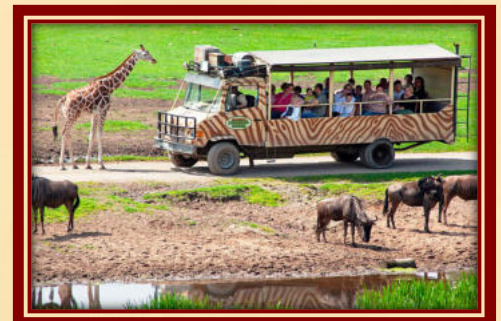
Kutschfahrt Lüneburger Heide